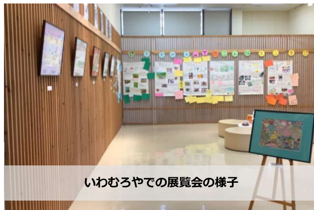
いわむろやでの展覧会の様子

6 月 29 日から 7 月 28 日まで「ラグーン展覧会 2022」が今年も実施されました。今年、ラグーン atorie 部の絵画だけでなく、「ラグーンってこんなところ」をテーマに、活動の内容や“みんなの思ひおすすりめ”等の紹介をしました。具体的には観てくださる方に、喫茶や創作など色々な活動を知ってもらうこと、その活動において個々が伝えたい思ひを表現し、ラグーンに興味を持って頂けるきっかけになることを願ひ、製作にあたりました。これまでの展覧会よりも多くのメンバーが、このイベントに携わられたことを嬉しく感じています。